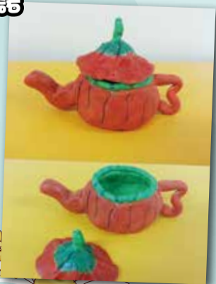
茶具 P.6 Ira Balberde