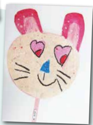
可愛的動物扇子 P.1 雷詩淇