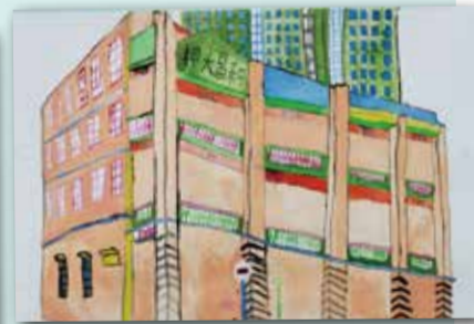
消失的一隅 P.5 董雲悅