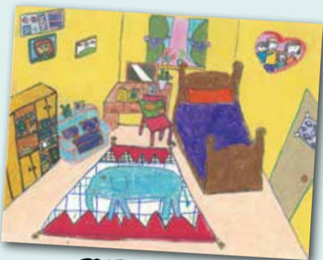
改造甚高房間 P.3 洪在山