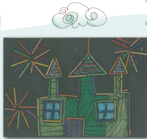
城堡上的煙火 P.1 陳翔印