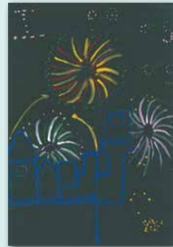
美麗的煙火 P.4 邱可晴