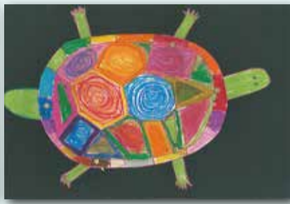
活動龜 P.2 劉梓嵐