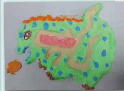
恐龍迷宮 P.4 林心妍