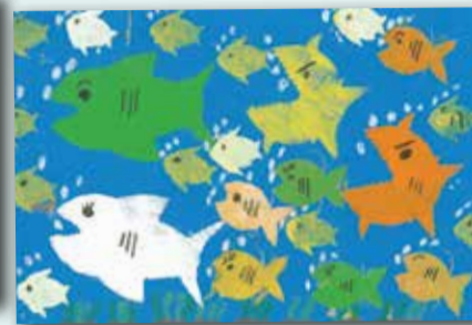
鯊魚來了 P.2 林希遙