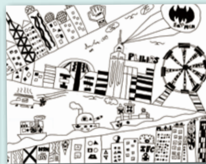
城市印象 P.5 Andre Invento