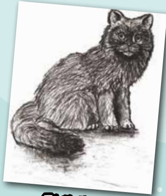
動物素描 P.6 甘灝康