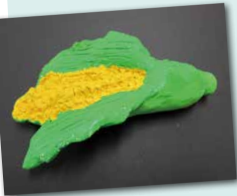
玉米 P.4 雷書銳