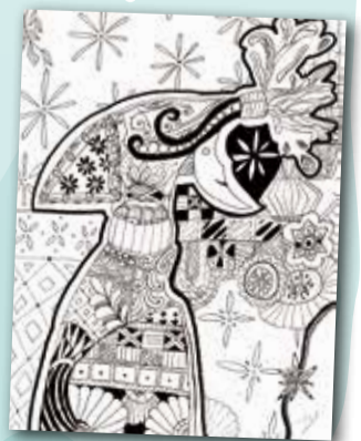
禪繞畫(噴霧器) P.6 梁梓鋒