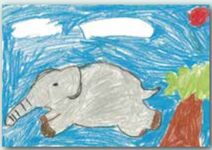
奔跑中的動物 P.2 Taylor Lonergan