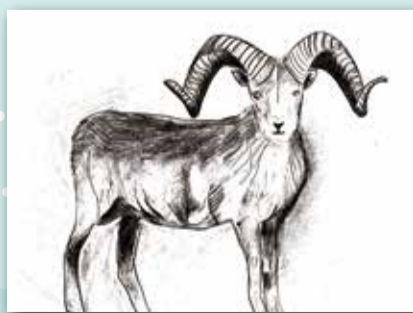
動物素描 P.6 張芷榕