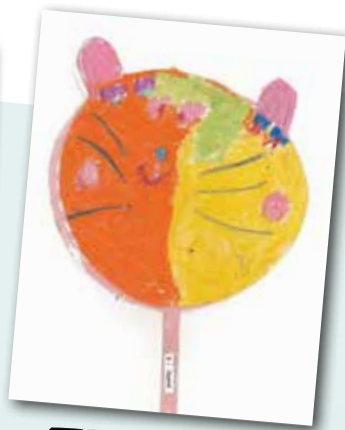
可愛的動物扇子 P.1 Harriet Brown