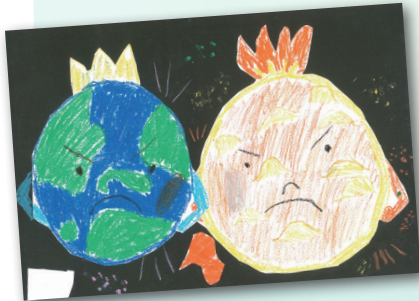
火星撞地球 P.3 丁珈晴