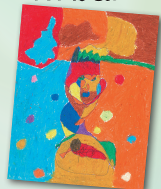
我的同學 (盲畫) P.5 黃嘉瑤