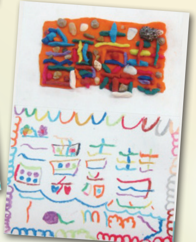
我的名牌 P.2 譚嘉慧