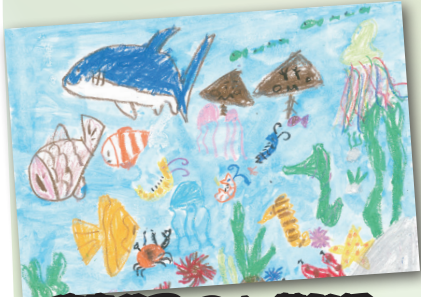
海底世界 P.1 黃雅嫻