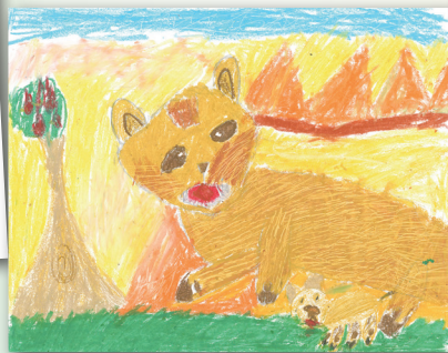
毛茸茸的動物 P.2 張家明