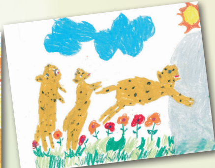
奔跑中的動物 P.2 Jasmine Weatherhead