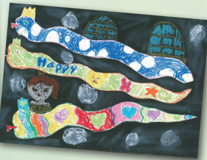
彩蛇一窩 P.3 邱可晴