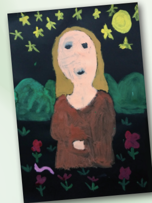
我眼中的蔡柳麗莎 P.4 Roshan Biswas