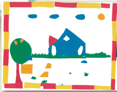
剪貼畫 P.1 林希遙