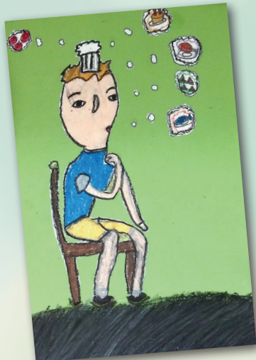
沉思者 P.5 鍾麗心