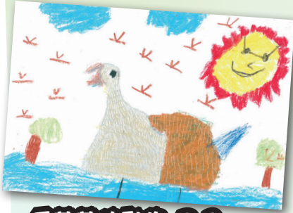
毛茸茸的動物 P.2 Westley Loneragan