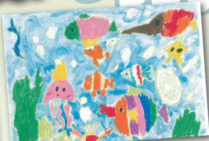
海底世界 P.1 劉梓嵐