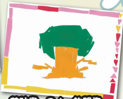
剪貼畫 P.1 許開頁