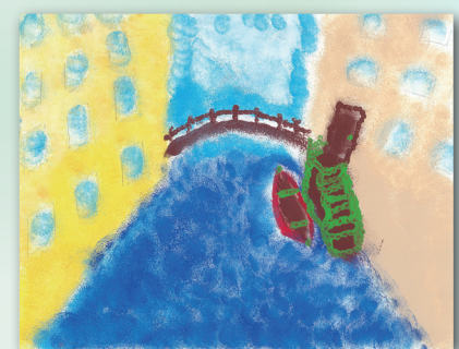
梅窩一角 (點描) P.6 羅綺綾