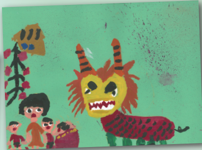
年獸 P.4 呂詠桐