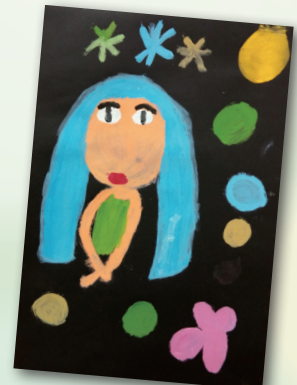
我眼中的蔡柳麗莎 P.4 陳柏如