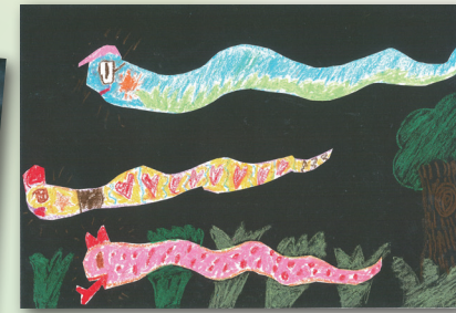
彩蛇一窩 P.3 曾茵嫻