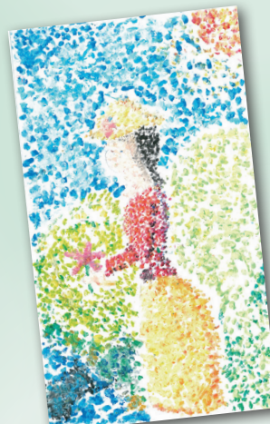
點描人生 P.6 方樂怡