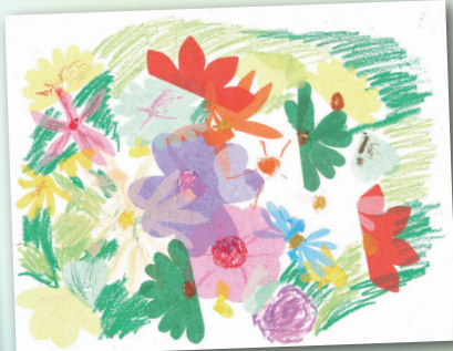
花花世界 P.3 林心妍