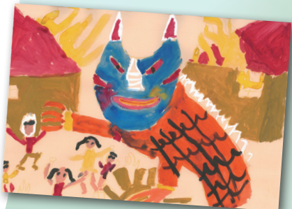
年獸 P.4 Ethan Downes