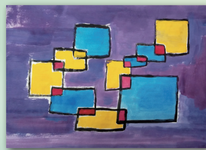
視藝迷宮 P.4 江煥璇