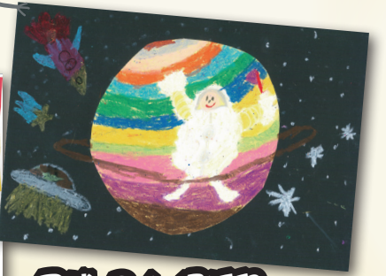
星球 P.1 楊巧兒