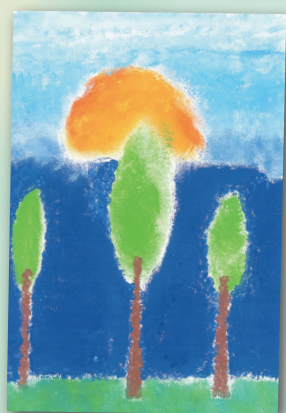
梅窩一角 (點描) P.6 溫國灝