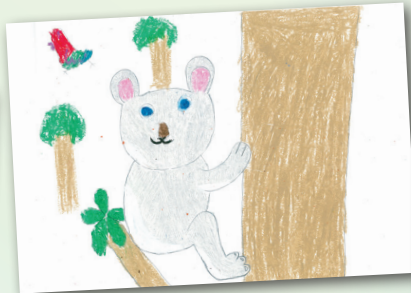
毛茸茸的動物 P.2 洪在山