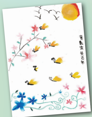
春 (水墨畫) P.6 黃凱宜