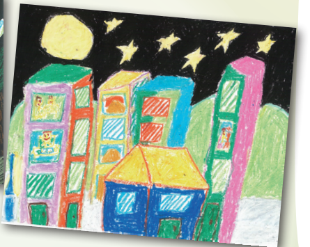
萬家燈火 P.3 黃書銳